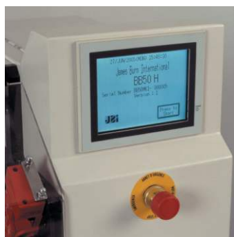
User-friendly control Panel de control táctil de fácil manejo Ecran de contrôle digital facile d'utilisation Benutzerfreundliche Bedienung