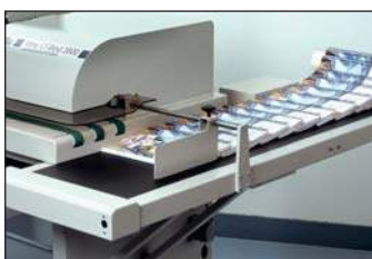
Reception of the books / Recepción de libros / Réception des ouvrages / Aufnahme der Büchern