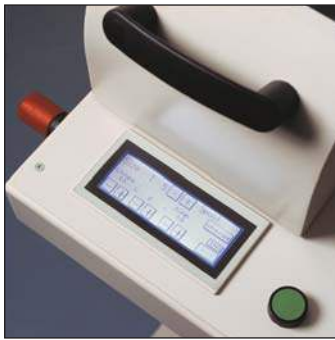
Easy to use touch screen Utilización fácil de la pantalla táctil Ecran de contrôle digital facile d'utilisation Einfache Touch-Screen-Steuerung